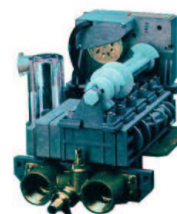
Particolare del regolatore di durezza